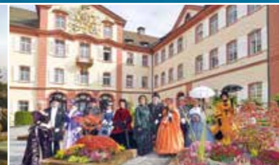
Festa dei Conti sul Castello dal 1 al 4 ottobre