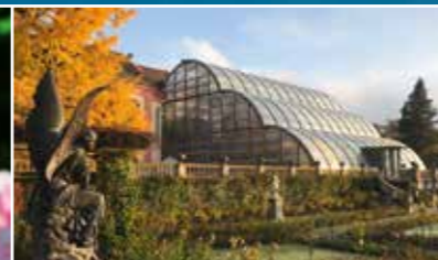
Esposizione autunnale nella Casa delle Palme dal 18 settembre all'1 novembre