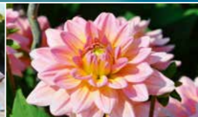
Fioritura delle dalie da fine agosto a ottobre