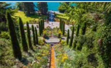
Atmosfera mediterranea – Scala d'acqua e fiori italiana