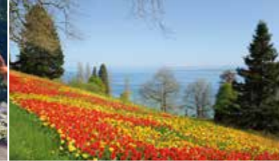
Fioritura di primavera da marzo a maggio