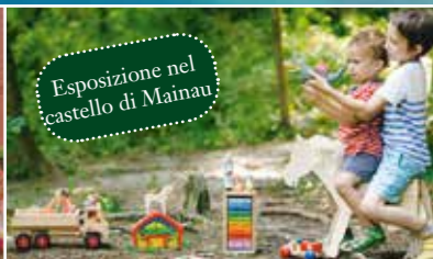
Esposizione nel castello di Mainau