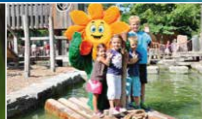
Un intero regno dei bambini per divertirsi e fare scoperte!