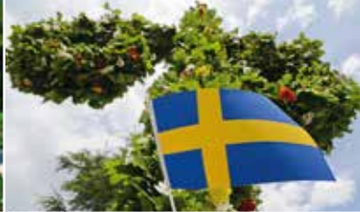
Festa svedese di mezza estate 20 giugno