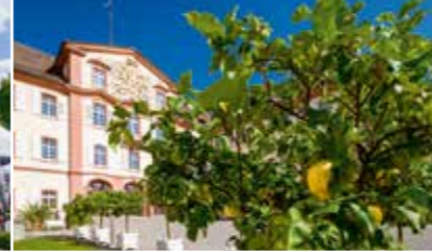
Collezione di agrumi storici da fine maggio fino a metà settembre