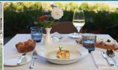
Une restauration raffinée