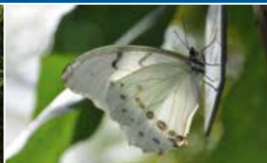
Sentiment de tropiques dans la serre exotique des papillons