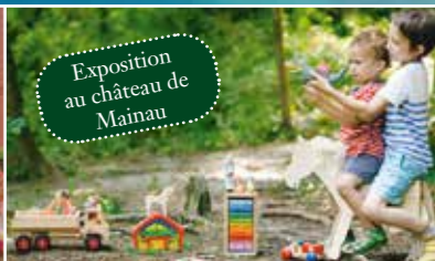
« L'univers multicolore des jouets en bois » 16 octobre 2020 au 7 février 2021