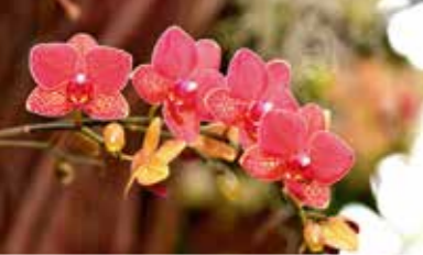
Exposition d'orchidées du 20 mars au 3 mai