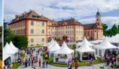
Fête comtale de l'île 21 au 24 mai