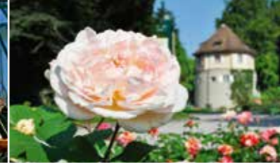
Floraison des roses de juin à septembre