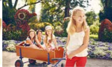
Chasse au trésor pour les enfants du 20 mars au 25 octobre